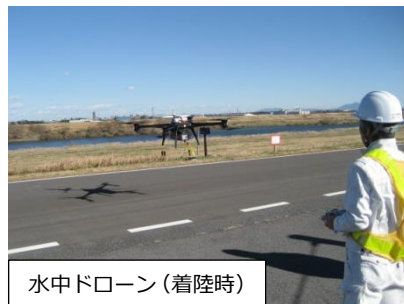
水中ドローン（着陸時）