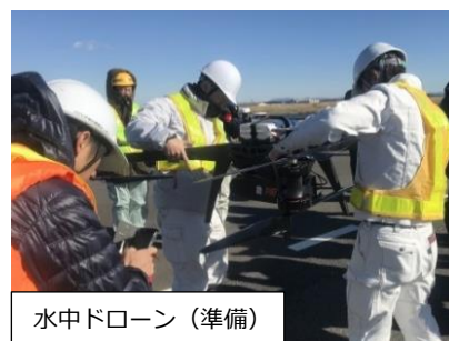
水中ドローン（準備）