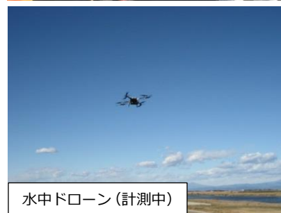
水中ドローン（計測中）